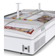
Ø-installation (hylder er tilkøb)