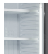
Vertikalt, indvendig lys