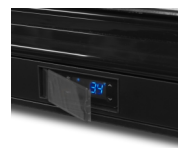
Beskyttende afskærmning af termostat