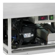
Automatisk fordampning af afrimningsvand