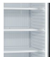
Vertikalt, indvendig lys