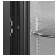
Dørstop ved opfyldning