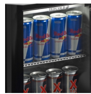
Designet til energidrikke