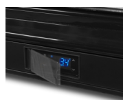
Beskyttende afskærmning af termostat