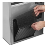
Kondensatorfilter er nemt at rengøre