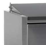
Rustfrit stål-låg for beskyttelse af fødevarer