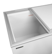
Flade skydelåg - skummet