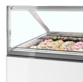
Frontglas med varmetråde