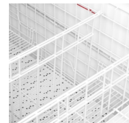
Justerbar falsk bund